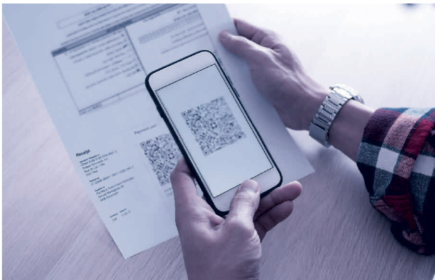
Scannen und fertig: Der QR-Code enthält alle relevanten Rechnungsdaten.

Lesen Sie mehr zum Thema im Blogbeitrag von TREUHAND|SUISSE unter www.treuhandswiss.ch/blog