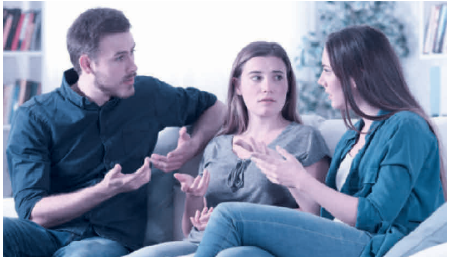
Kommt es zum Streit zwischen den Erben, muss der Willensvollstrecker schlichten.

Der Willensvollstrecker setzt den letzten Willen des Erblassers um. Dafür stellt er als Erstes ein Inventar auf, das er laufend nachführt. Er verwaltet die Erbschaft bis zur Teilung und muss darauf achten, dass das Vermögen erhalten bleibt. Er bezahlt die Schulden des Erblassers inklusive der Todesfallkosten und treibt offene Forderungen ein. Zur Verwaltung gehören auch die laufenden Geschäfte, beispielsweise muss er sich um den Unterhalt von Liegenschaften kümmern, laufende Verträge kündigen oder allenfalls die Liquidation einer Einzelunternehmung umsetzen. Er ist verantwortlich für die Erstellung der