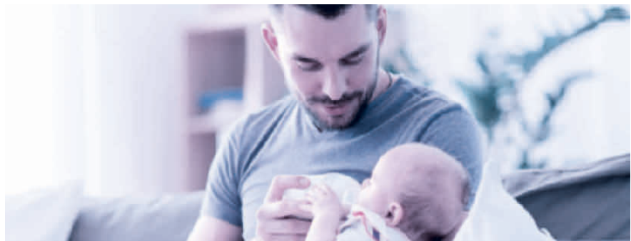
Vaterschaftsurlaub: innert sechs Monaten nach der Geburt zu beziehen.

Das Unternehmen muss dem Vater zehn arbeitsfreie Tage gewähren und hat für diese Zeit Anspruch auf 14 Taggelder. Es ist Sache des Arbeitgebers, bei der Ausgleichskasse – welche auch die EO-Beiträge abrechnet – den Antrag auf die Vaterschaftsentschädigung zu stellen. Der Antrag sollte aber erst gestellt werden, wenn der Arbeitnehmer den ganzen Vaterschaftsurlaub bezogen hat und der Arbeitgeber dies mit dem Antrag bestätigen kann. Die Auszahlung der Vaterschaftsentschädigung erfolgt dann nachgelagert